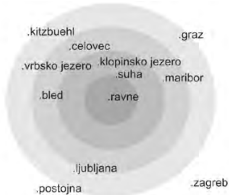
Shema turističnih točk v radiju 150km.

V radiju 200 km obstaja nekaj turističnih destinacij, ki so lahko zaradi svoje uspešnosti zgled za Forma Vivo na Ravnah, tako v smislu organizacije, kakor ponudbe za turiste in razdelane turistične infrastrukture. Posebej pomembno pa je, da gre za turistične destinacije s katerimi se lahko Ravne v prihodnosti povezujejo, iščejo sinergijo in na primer vzpostavijo sodelovanje v smislu medsebojne promocije ali organizacije enodnevnih izletov, kar omogoča bližina teh krajev.