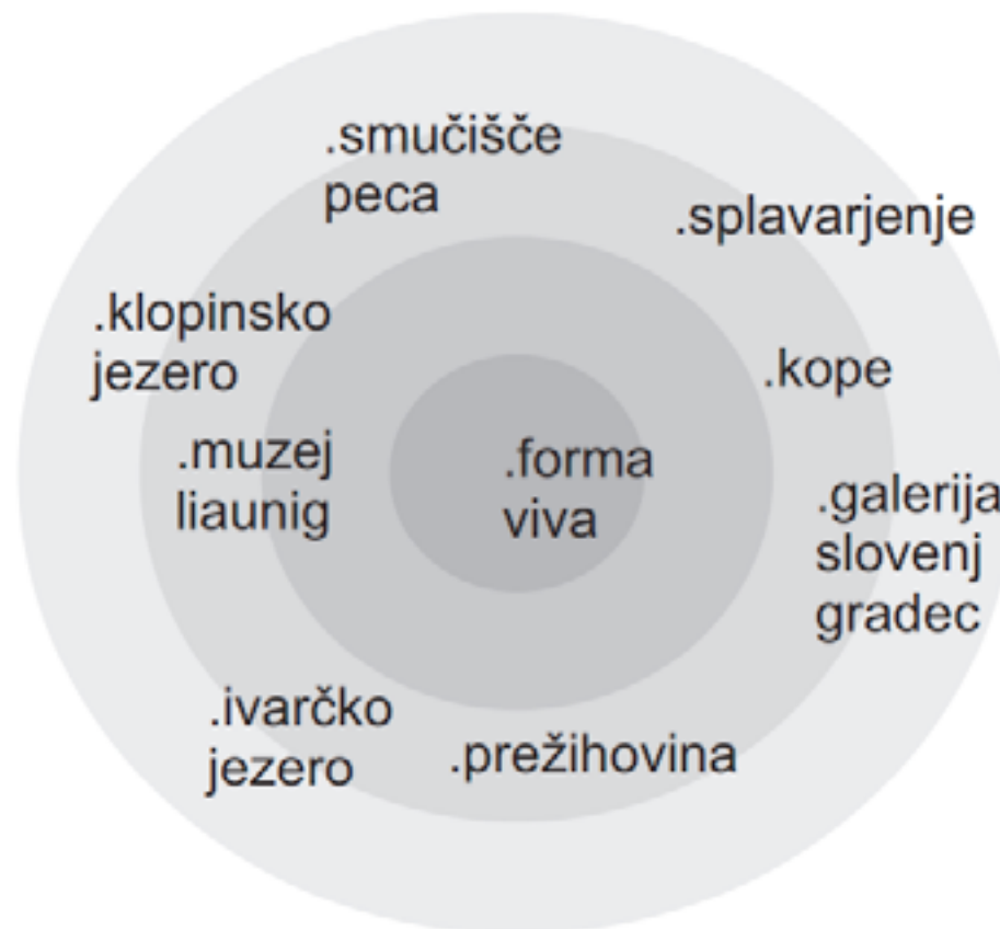
Shema turističnih točk v neposredni bližini Raven na Koroškem.

Poleg širše okolice pa je tudi v neposredni bližini Raven nekaj turističnih točk s katerimi je potrebno poiskati skupen interes za sodelovanje na turističnem področju tako na Koroškem (GTC Kope, splavarjenje, KGLU) kot na Avstrijskem Koroškem (smučišče Peca, Klopinsko jezero, Liaunig muzej). Znotraj občine Ravne je že bil nakazan interes o povezovanju in vključevanju Ivarčkega jezera v omrežje turistične ponudbe Raven in razvoja Forma Vive.